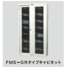
FMS-GRタイプキャビネット

標準価格 391,000 円 (税別) W955×D400×H1790 (mm) 重量 120.6 kg 収納媒体/8mm キャビネット収納巻数 (5段) / 360巻 (1棚当り72巻) 棚板仕様/上段仕切り固定板、下段仕切り固定板、棚段数5段