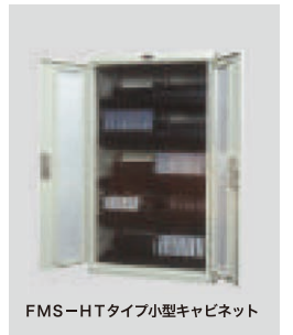
FMS-HTタイプ小型キャビネット

標準価格 312,000 円 (税別) W680×D500×H1160 (mm) 重量 66.0 kg 収納媒体/8mm キャビネット収納巻数 (3段) / 144巻 (1棚当り48巻) 棚板仕様/上段仕切り固定板、下段仕切り固定板、棚段数3段