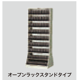
オープンラックスタンドタイプ

標準価格 482,000 円 (税別) W955×D400×H1790 (mm) 重量 127.0 kg 収納媒体/8mm キャビネット収納巻数 (5段) / 420巻 (1棚当り60巻) 棚板仕様/前立スタンド×2個、後列スタンド×3個、棚段数7段、スタンド35個