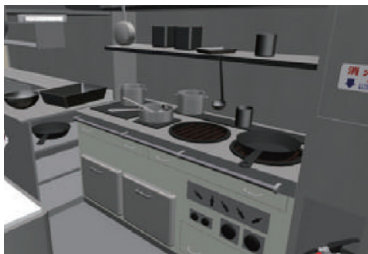
Kitchen Grease traps at restaurants