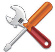
The escape of oil during installation and maintenance works