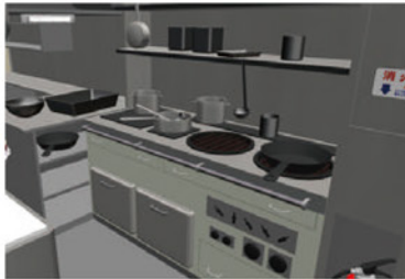
飲食店厨房のグリスト ラップ油回収