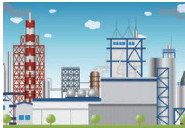
Factory oil waste