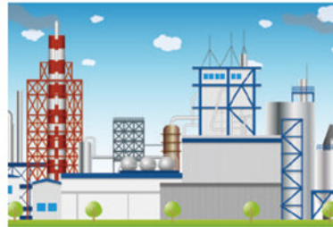
工場の廃油処理対策 油水分離槽の浮上油回収