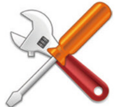
メンテナンス時の オイル拭き取り