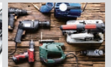
充電式工具の集中充電に