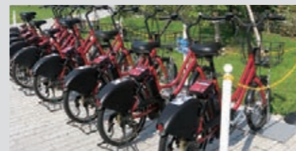
シェアサイクル用電動アシスト自転車の充電に