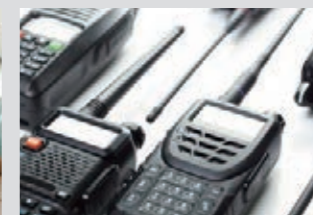
無線機・トランシーバーの充電に