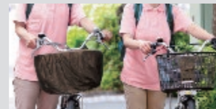
訪問介護の電動アシスト自転車の充電に