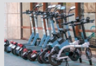
電動キックボードの充電に