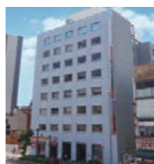
本社/ショールーム(予約制)