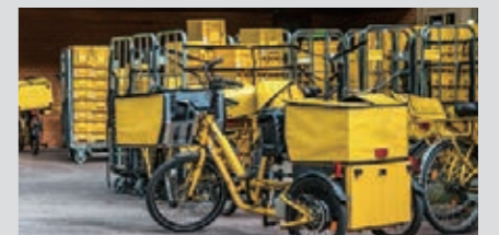
配達業社の電動アシスト自転車の充電に