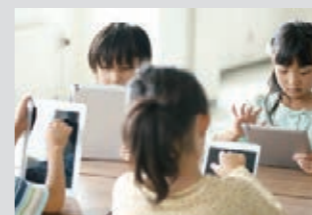
教育用タブレットの充電に